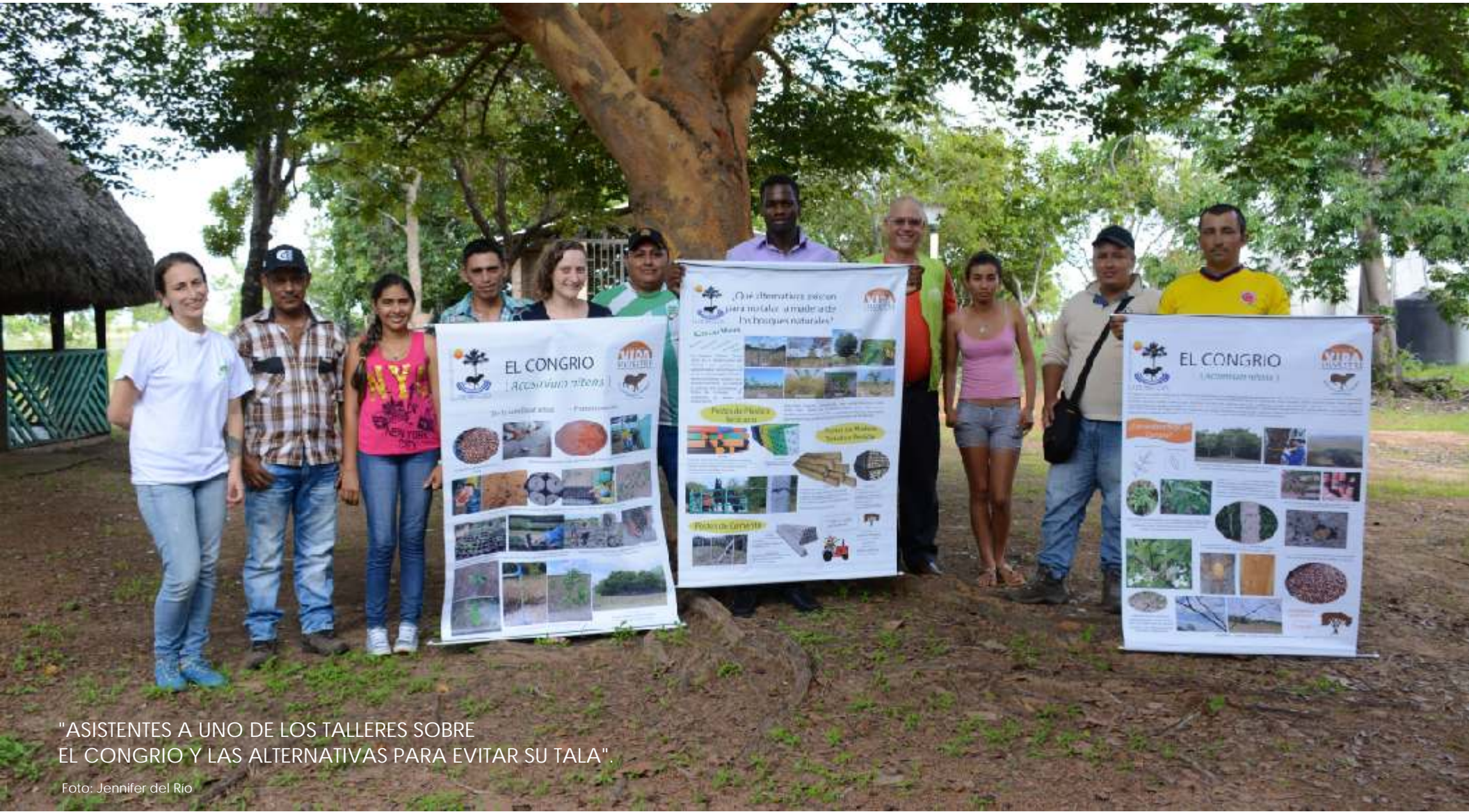
"ASISTENTES A UNO DE LOS TALLERES SOBRE EL CONGRIO Y LAS ALTERNATIVAS PARA EVITAR SU TALA".