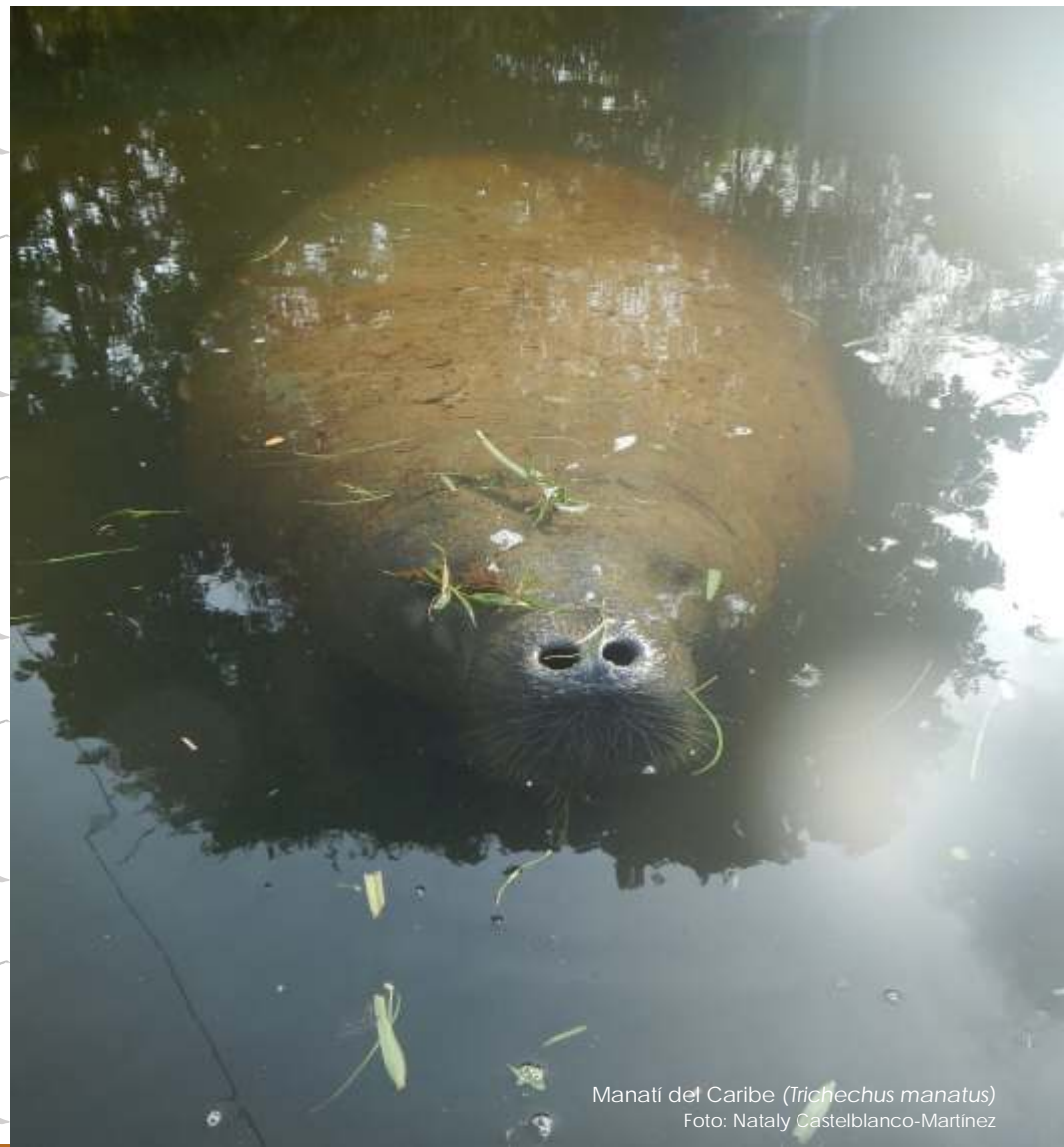
Manatí del Caribe ( Trichechus manatus )

Boletín Informativo del Proyecto Vida Silvestre Edición No. 04 Junio de 2016